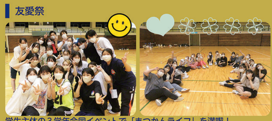
学生主体の3学年合同イベントで「まつかんライフ」を満喫!