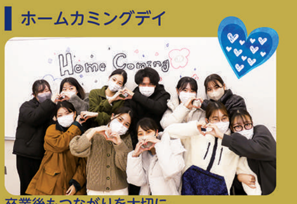
卒業後もつながりを大切に、いつでも帰って来ることができる母校です