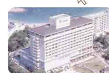
▲ラフォーレ南紀白浜

各ホテルにお問い合わせください。 (蔵王、那須、強羅、伊東、修善寺、山中湖、中軽井沢 白馬八方、琵琶湖、南紀白浜、東京、新大阪)